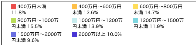
世帯年収 (Aiプレミアムクラブ会員の属性データ)